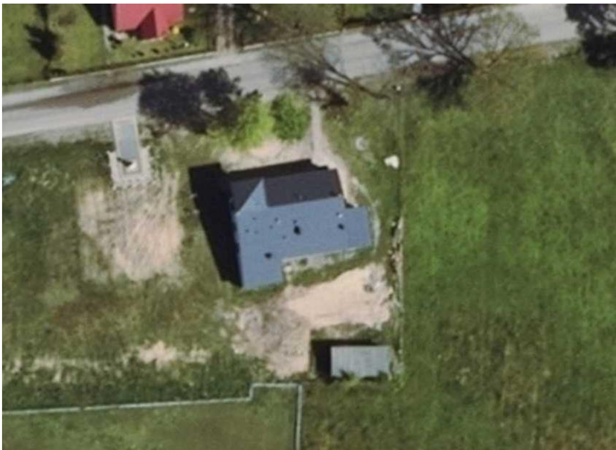
Lokalizacja obiektu do wykonania inwestycji.