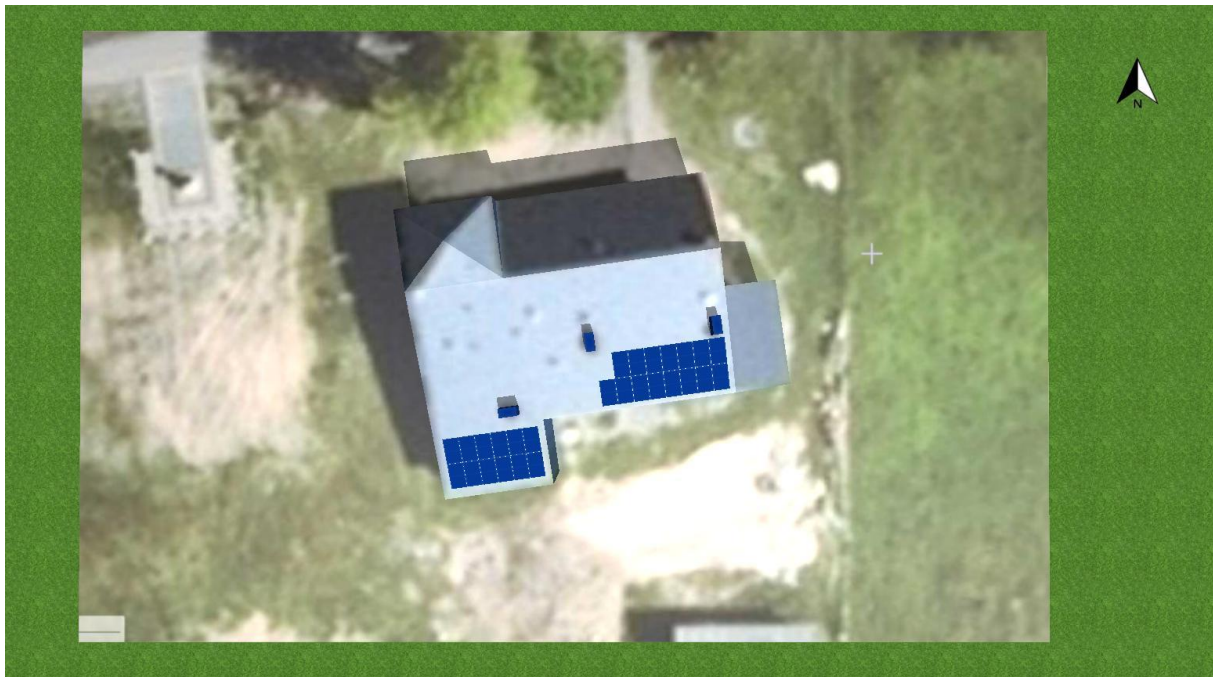
Rozmieszczenie instalacji fotowoltaicznej na dachu budynku.

Instalacja fotowoltaiczna ma powstać na dachu budynku Świetlicy Wiejskiej w m. Żelazna Rządowa.