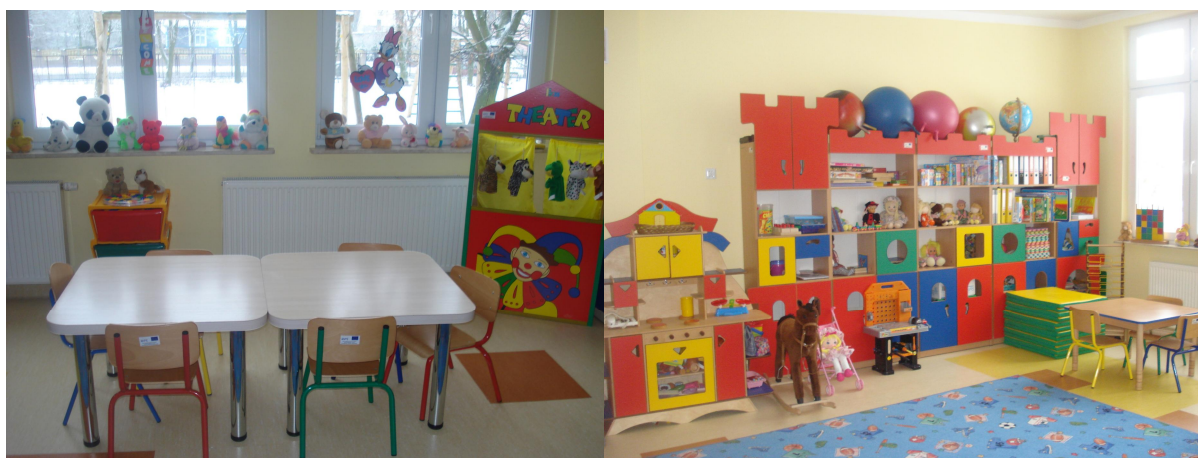
Fot.5 Lokalny Ośrodek Kultury w Małowidzu – ośrodek przedszkolny