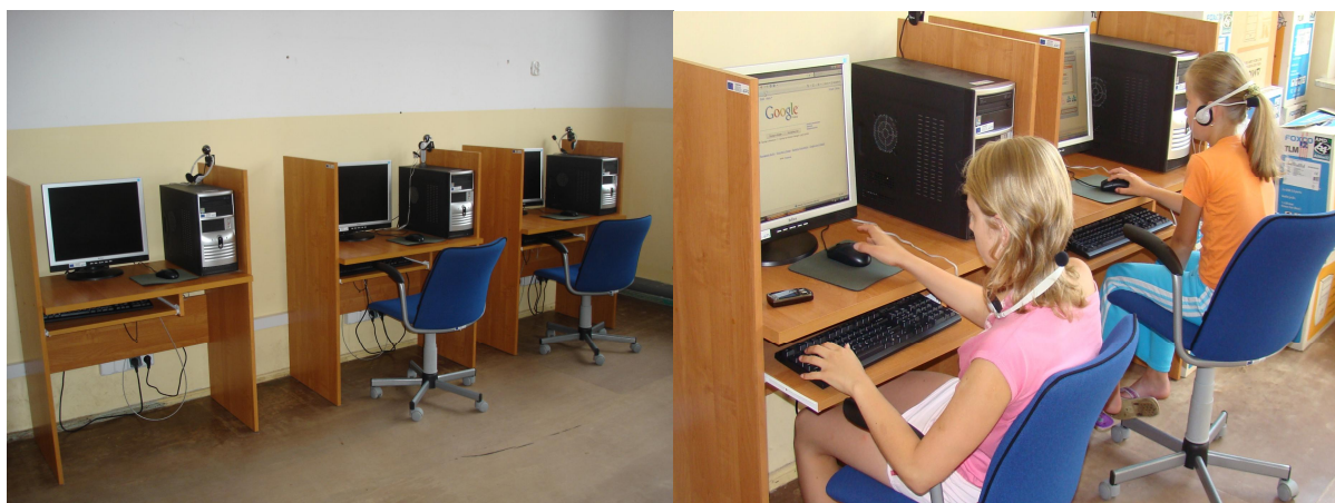
Fot.4 Lokalny Ośrodek Kultury w Małowidzu – pracownia komputerowa