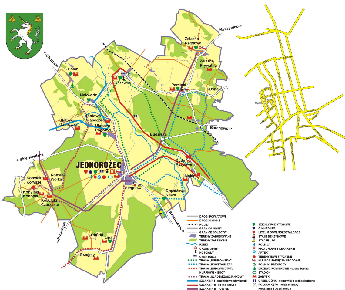
Rys. Szlaki kulturowe na terenie gminy Jednorożec

C – nawierzchnia naturalna piaszkowa doziarniona (długość 20,0 km).