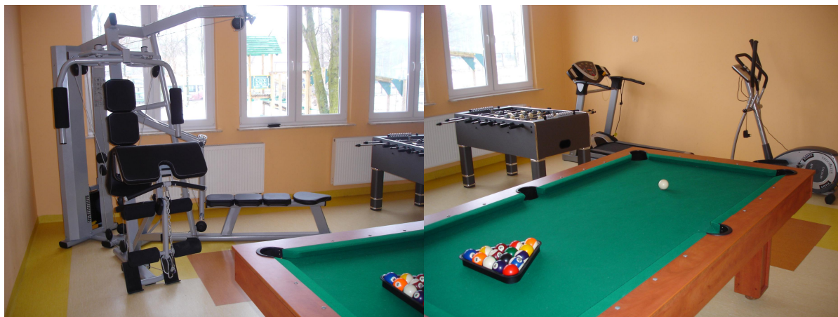
Fot.6 Lokalny Ośrodek Kultury w Małowidzu – siłownia