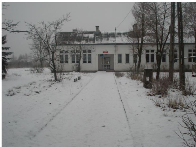
Fot.1 Budynek byłej szkoły podstawowej zaadaptowany pod Lokalny Ośrodek Kultury - elewacja frontowa

Celem wszystkich powyższych inicjatyw jest sprawienie, aby w miejscowości Małowidz powstały miejsca gdzie zarówno dorośli jak i młodzież i dzieci będą mogły przyjemnie i pożytecznie spędzać czas wolny, a także miejsca dla uprawiania sportów oraz turystyki rowerowej i pieszej.