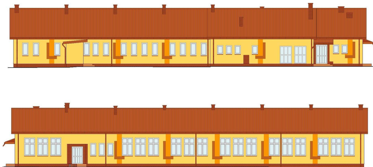
Fot.3 Wizualizacja budynku byłej szkoły podstawowej zaadaptowanej pod potrzeby Lokalnego Ośrodka Kultury po wykonaniu przewidzianych prac termomodernizacyjnych