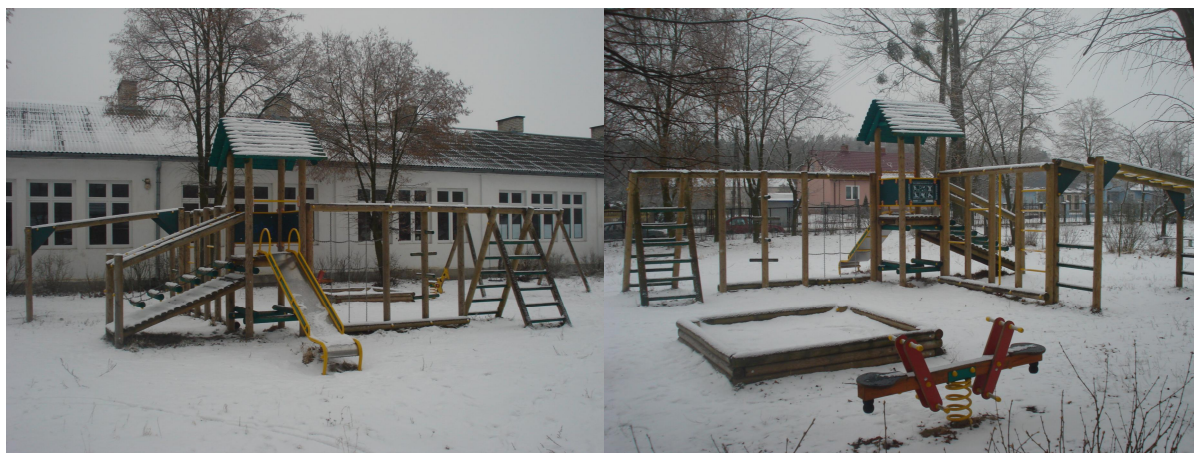
Fot.7 Lokalny Ośrodek Kultury w Małowidzu – plac zabaw