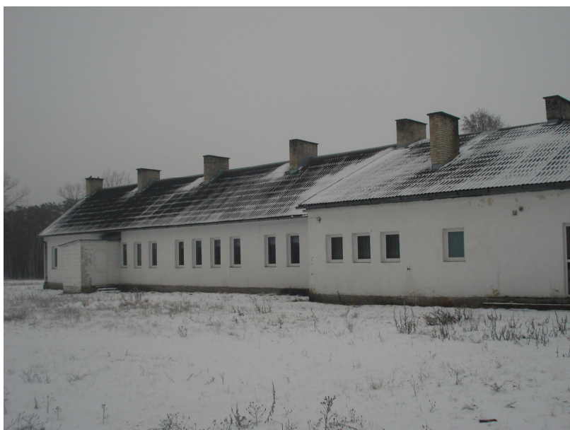
Fot.2 Budynek byłej szkoły podstawowej zaadaptowany pod Lokalny Ośrodek Kultury – elewacja tylna