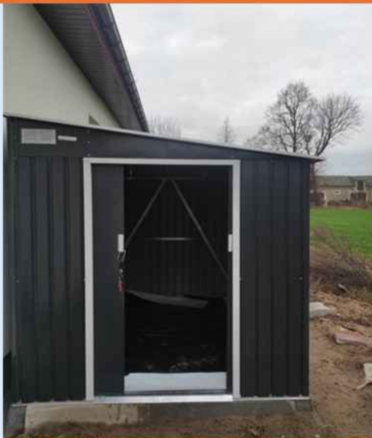
Zakup domku narzędziowego na plac przy świetlicy wiejskiej w Obórkach

Remont świetlicy wiejskiej i budynku gospodarczego w Kobylakach-Koryszach