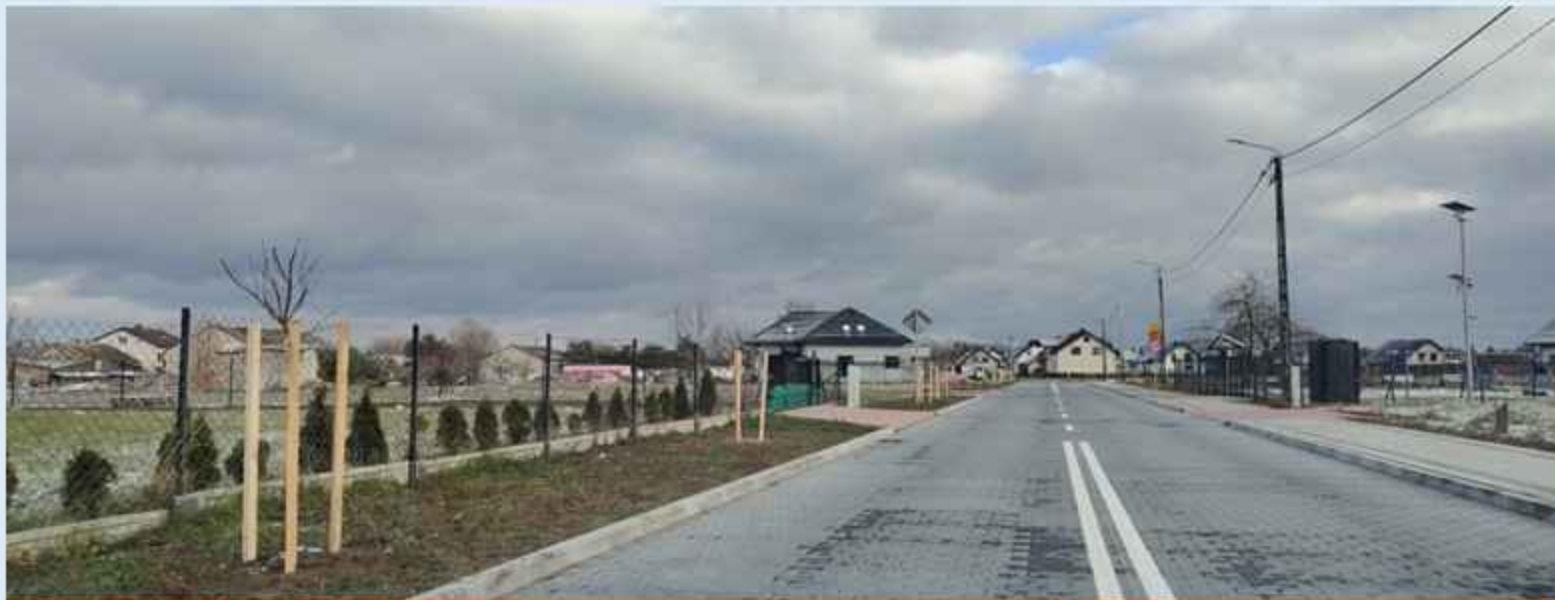
Zakup drzewek ozdobnych oraz worków nawadniających na teren Sołectwa Stegna

Zakup wyposażenia świetlicy wiejskiej w Połoni, Olszewce, Żelaznej Rządowej, Kobyłakach-Koryszach