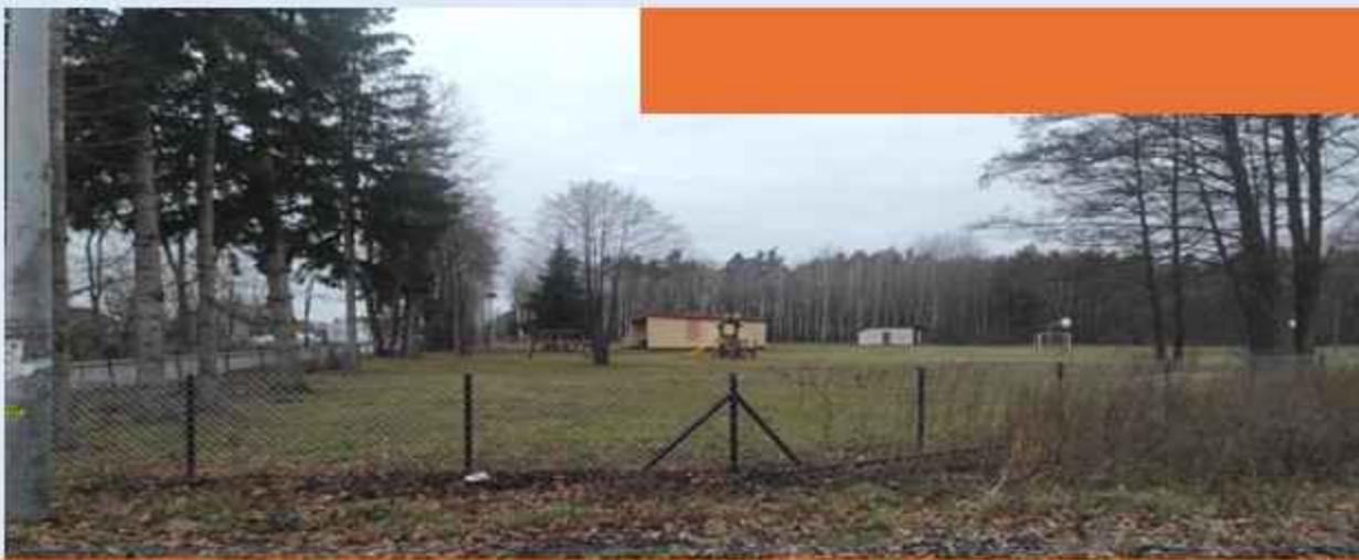
Ogrodzenie placu wiejskiego przy budynku byłej szkoły w Ulatowie-Pogorzeli