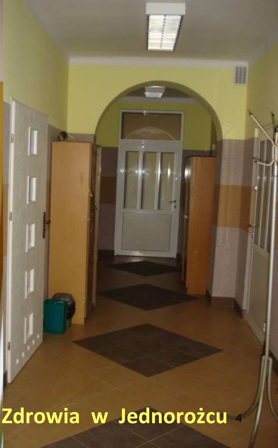
Ośrodek Zdrowia w Jednorożcu 4