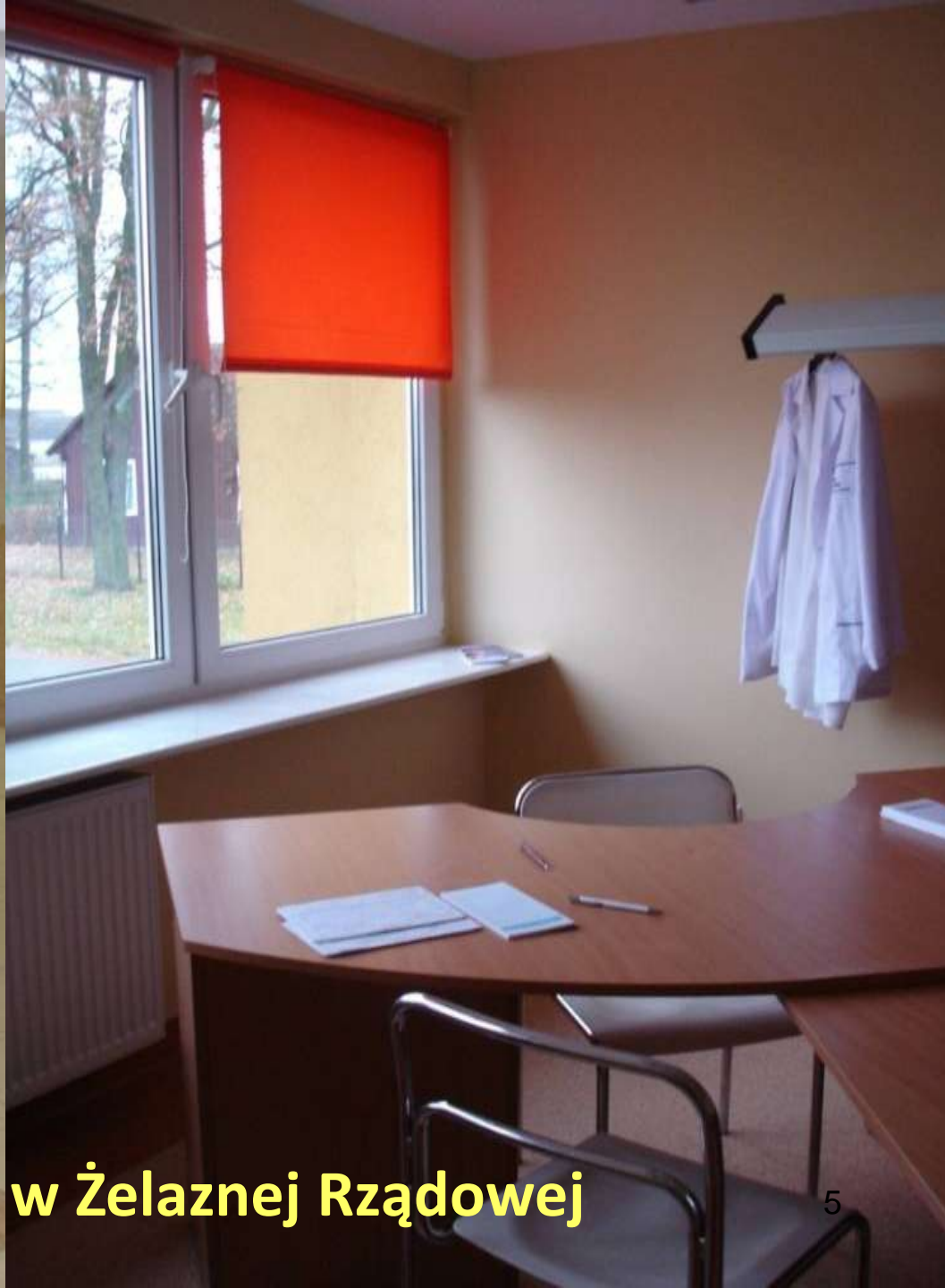
Ośrodek Zdrowia w Żelaznej Rządowej