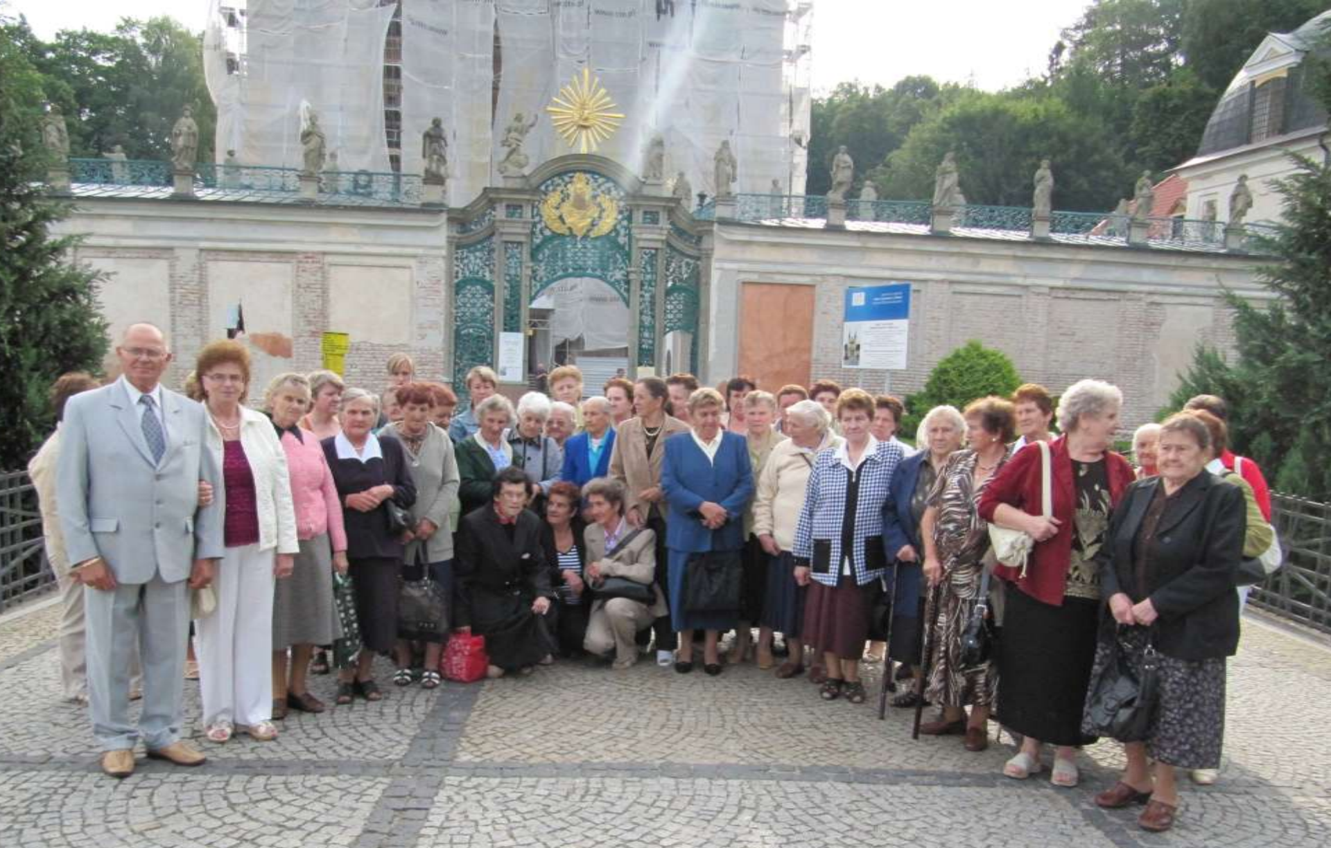
Wycieczka dla seniorów do Świętej Lipki