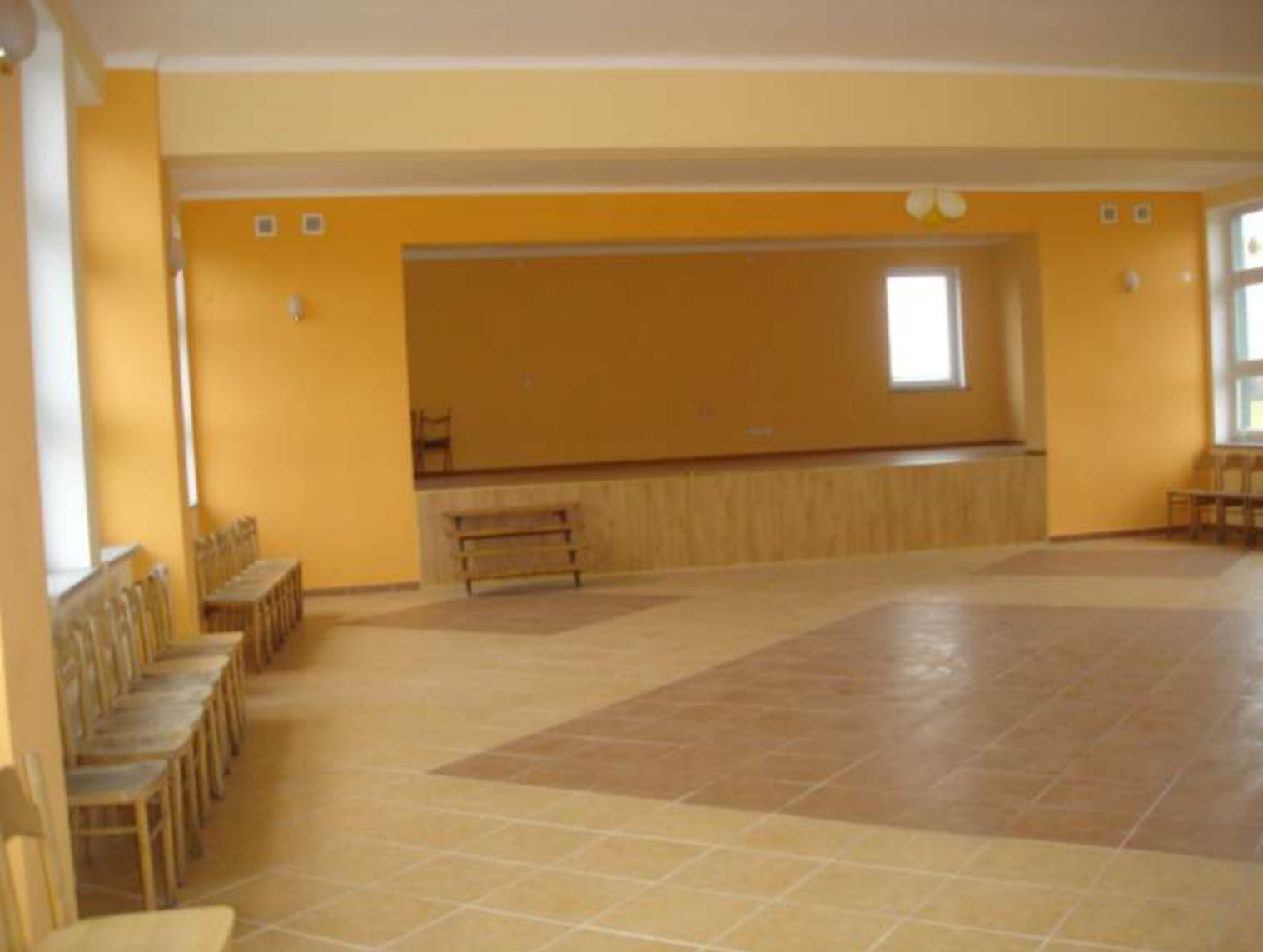
Świetlica wiejska w Ulatowie-Pogorzeli