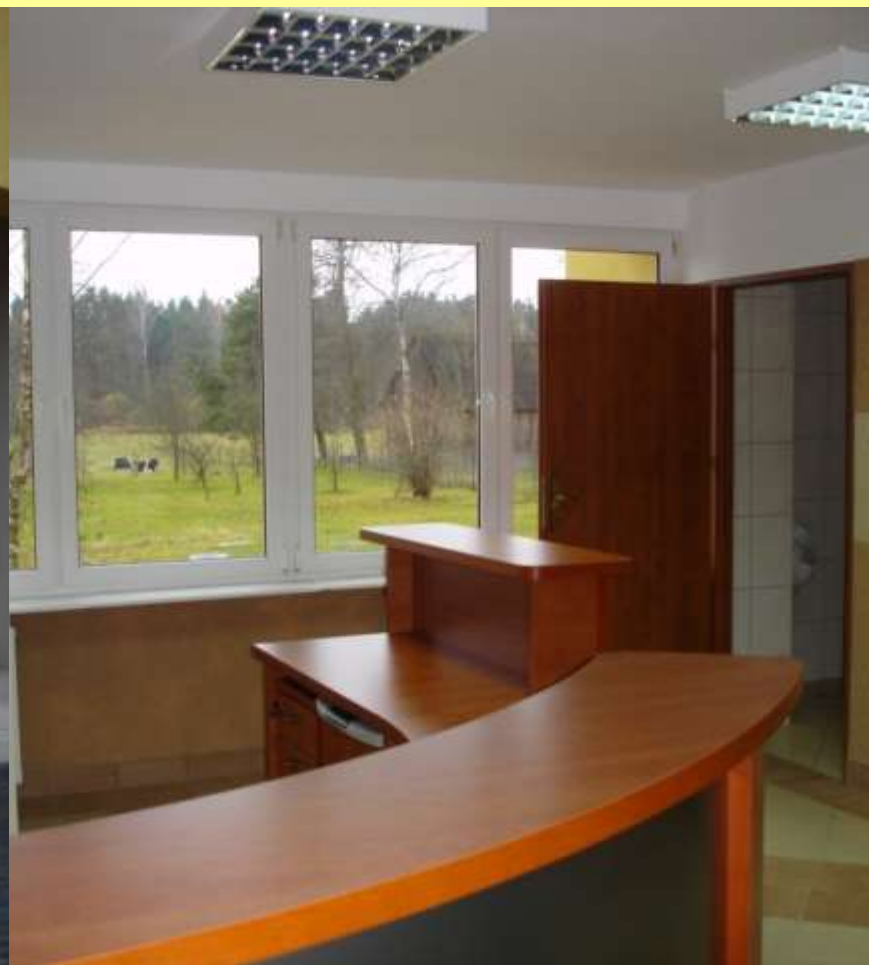
Ośrodek Zdrowia w Żelaznej Rządowej