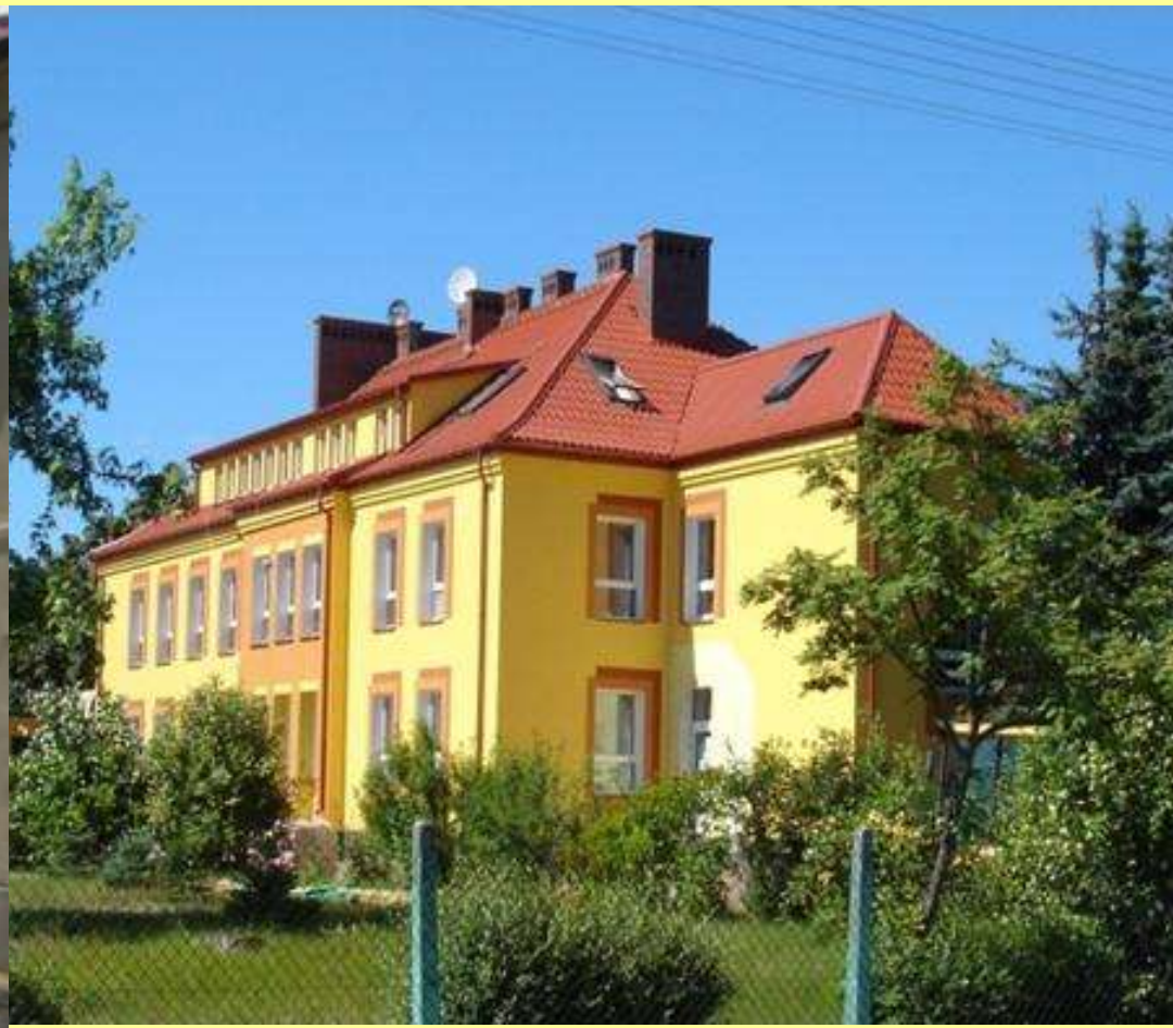
Ośrodek Zdrowia w Jednoróżcu